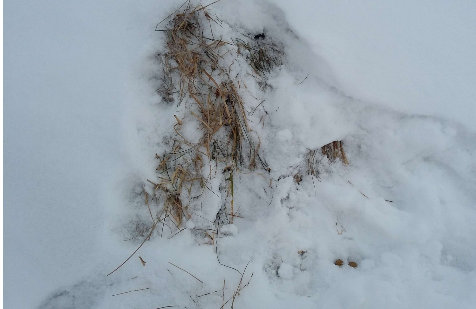
Frassspuren Schneehase mit zwei Kotballen

Analog dem Feldhasen nehmen Schneehasen ihren ersten Kot (Blinddarmkot) direkt vom After nochmals auf und verdauen ihn ein zweites Mal.